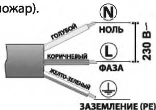
Пример подключения сетевого кабеля.

Аппарат не оборудован сетевой вилкой. Соединение кабеля сварочного аппарата с распределительным устройством должно быть оборудовано зажимами. В случае работы на максимальных токах, аппарат необходимо оснащать силовой однофазной вилкой 32А 230В (не входит в комплект) подходящей под вашу местную сеть.